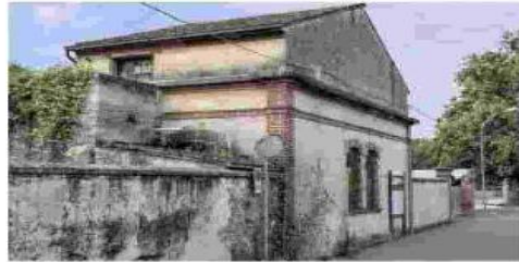
Uno scorcio dell'ex macello di Monticelli