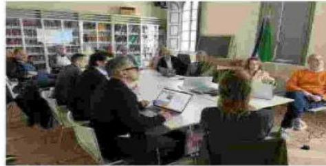
L'incontro sul futuro dell'ex macello di Monticelli

mi Distante , chesta studiando la fattibilità di un progetto di rigenerazione del complesso dell'ex macello: potrebbe diventare una 'Casa delle associazioni', ma anche ospitare un 'Bike center' a servizio del cicloturismo sugli argini del Po. Questa progettualità ha una valenza territoriale anche più ampia e si inserisce in un quadro di collabo-