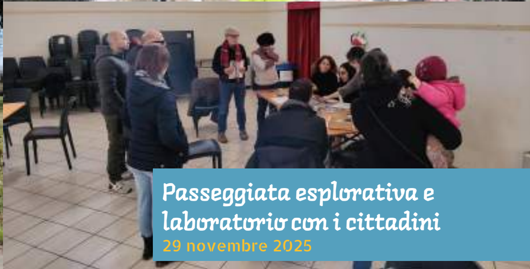
Passeggiata esplorativa e laboratorio con i cittadini 29 novembre 2025