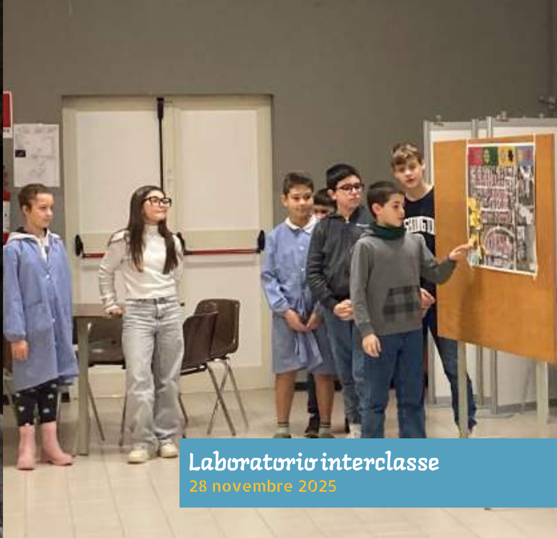
Laboratorio interclasse 28 novembre 2025